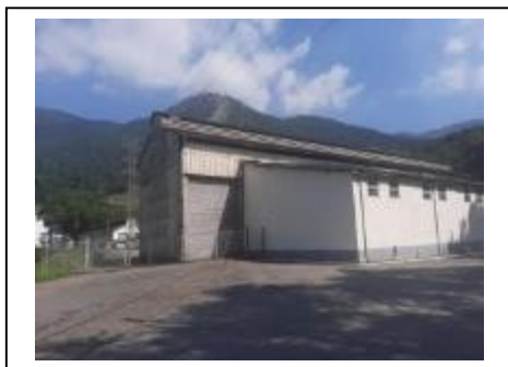
5) Armazém 01