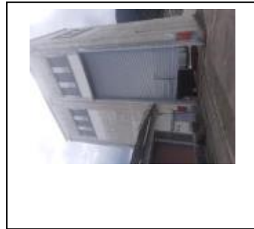
2) Área reservada – Torre de Manipulação