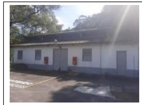
4) Depósito 2 - Inflamáveis.