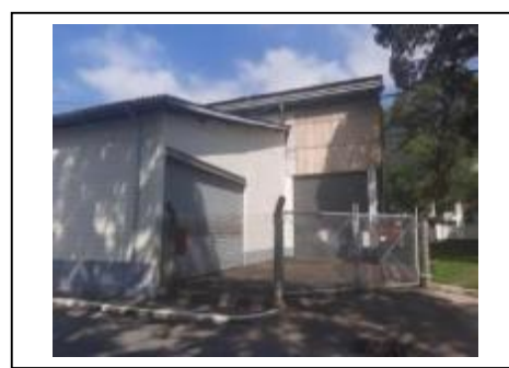
6) Armazém 02.