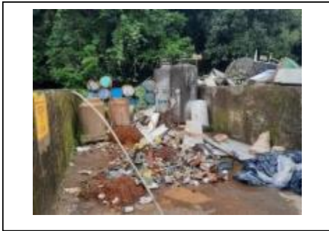
1) Área de descarte – Jato de areia