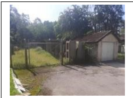
3) Depósito 01 – Pátio de telhas